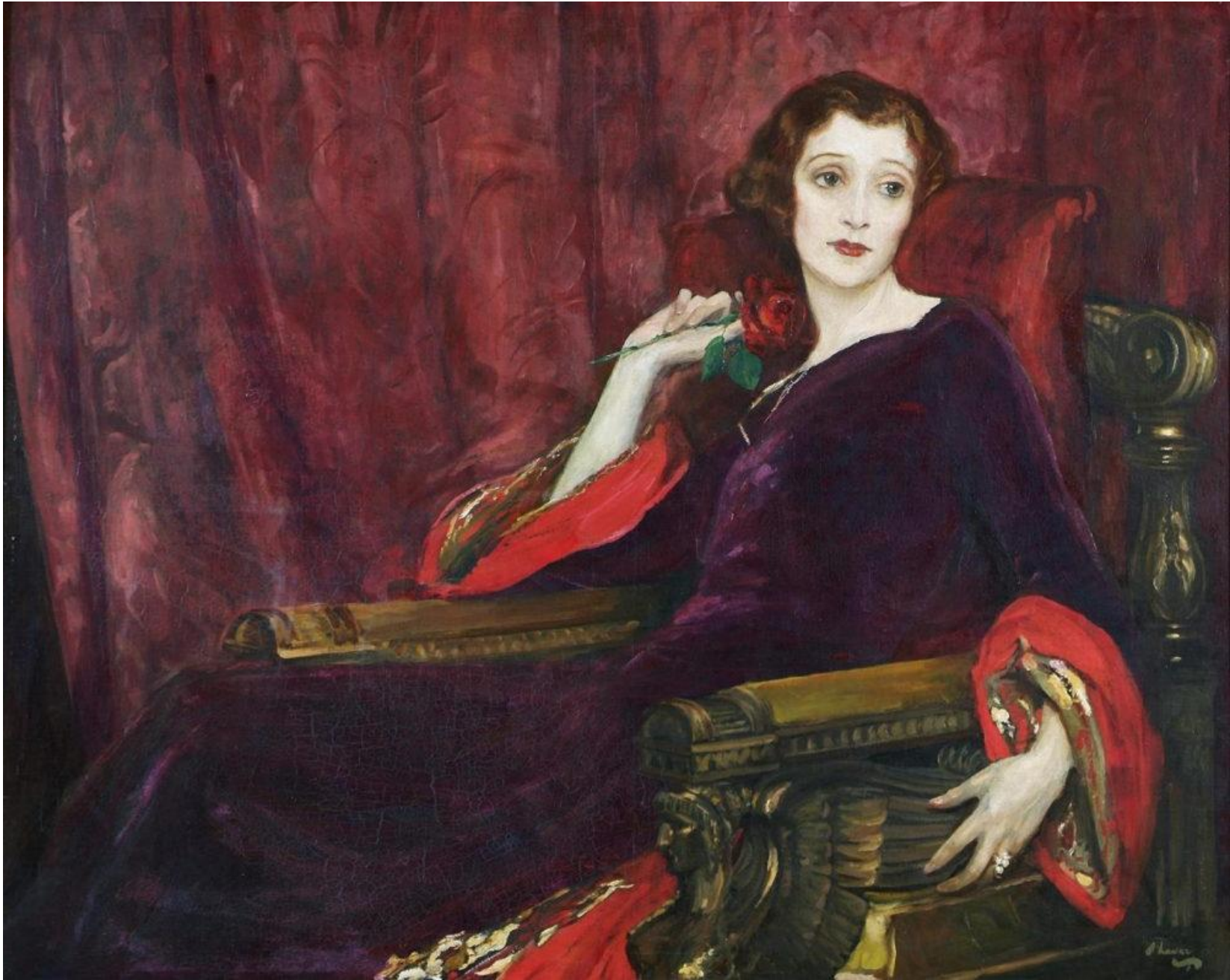
The Red Rose (1923) le John Lavery, olaphictiúr ar chanbhás.