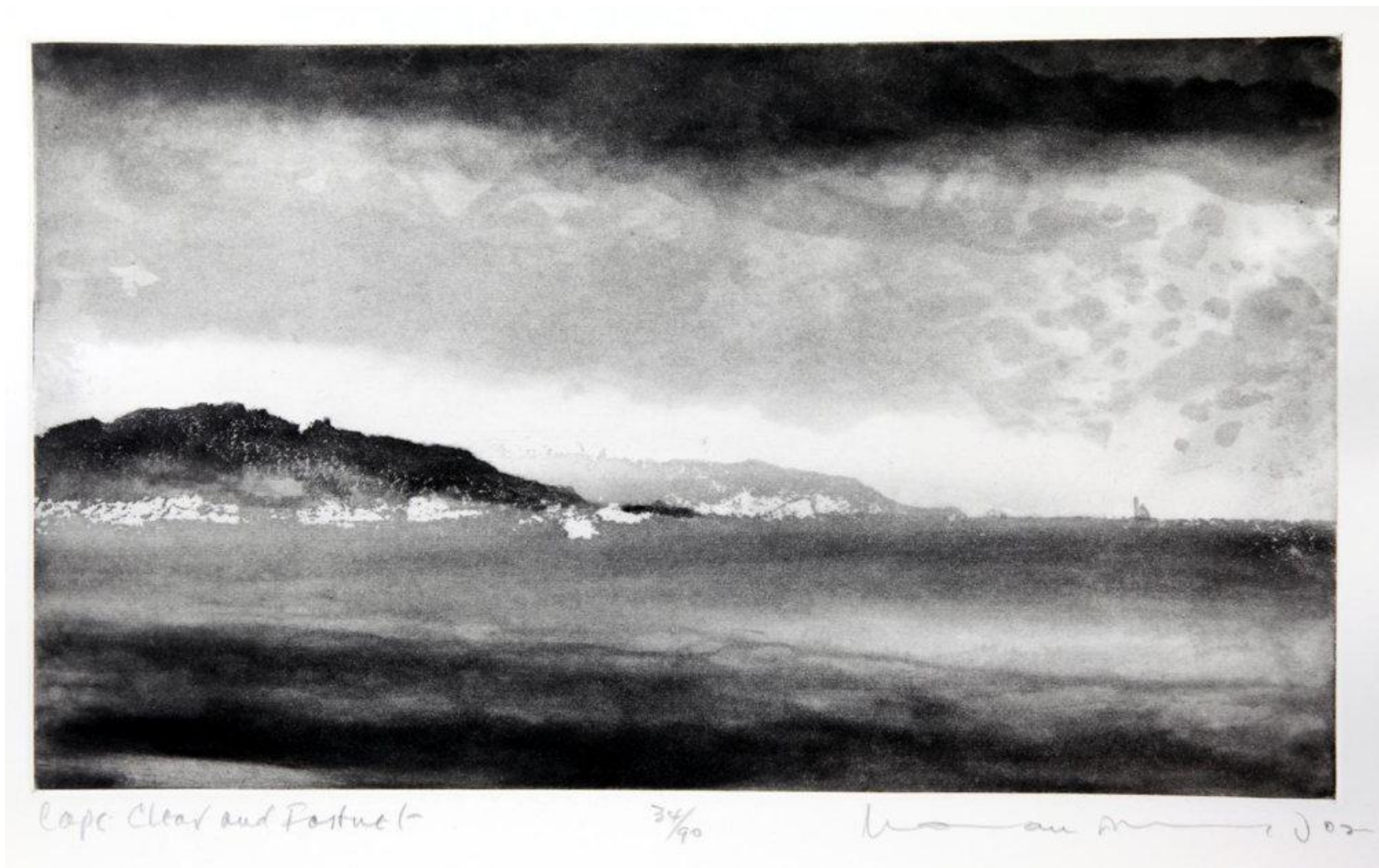
Cape Clear and Fastnet , (2002) Norman Ackroyd, eitseáil.